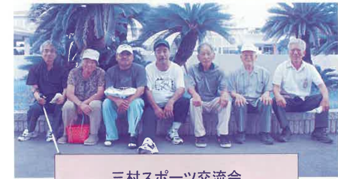
三村スポーツ交流会