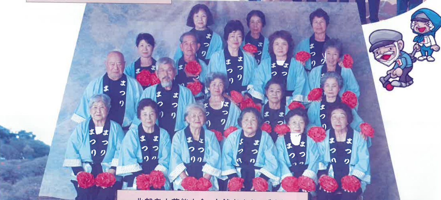
北部老人芸能大会 有銘老人クラブ出場