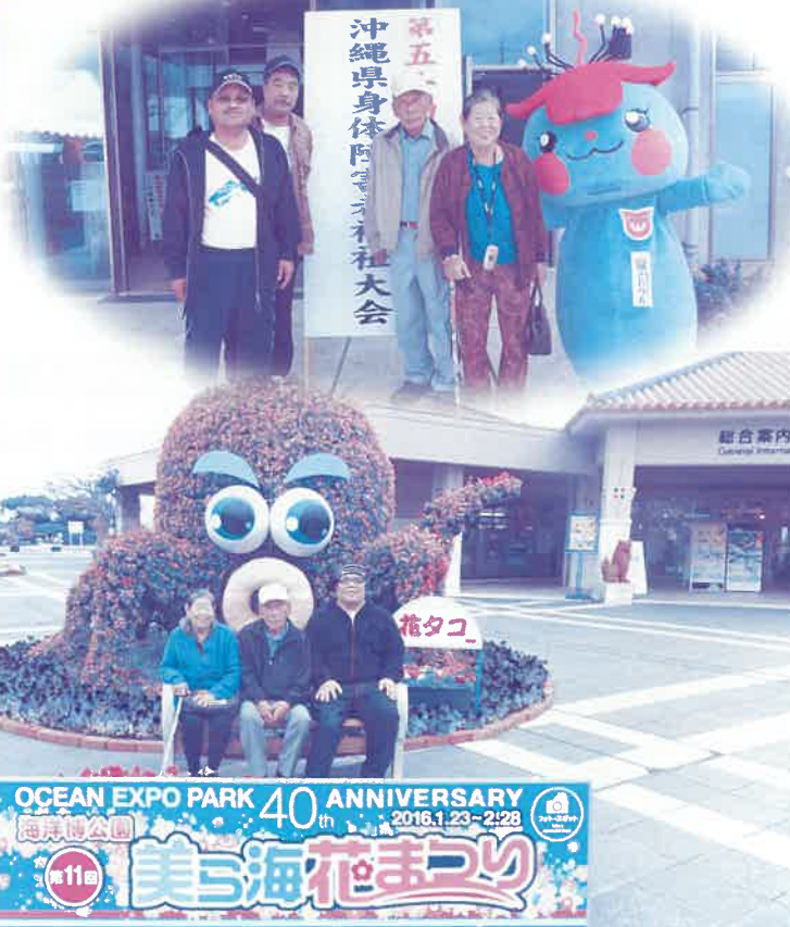
OCEAN EXPO PARK 40th ANNIVERSARY 11回 海の花まつり