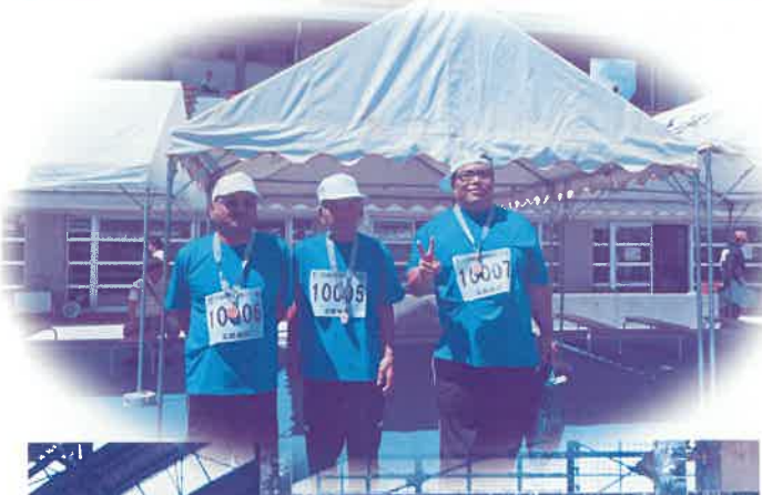
グラウンドゴルフ交流会