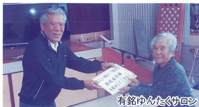
有銘ゆんたくサロン