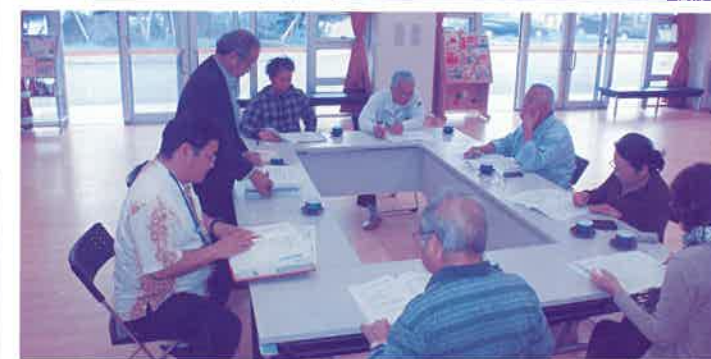
共同募金運営委員会