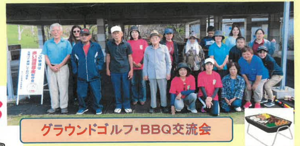
グラウンドゴルフ・BBQ交流会

ひとにやさしい町は、じぶんにもやさしい町です。 じぶんの町を良くする、いろいろな活動が、もっと元気になるよう応援します。