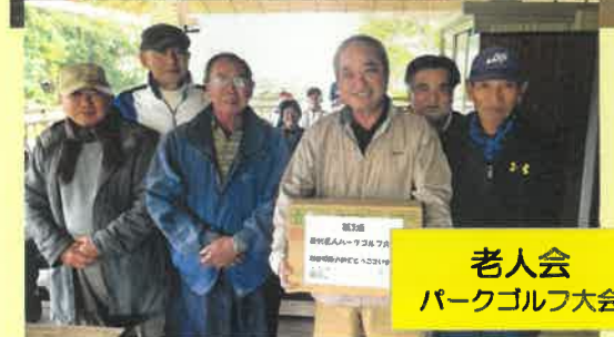
老人会 パークゴルフ大会