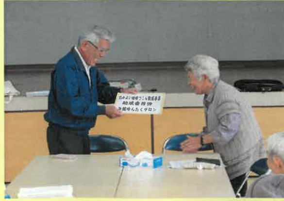
有銘ゆんたくサロン

地域が抱える多様な問題を地域で解決していくため、柔軟かつ多様な地域が元気になる取り組みを通じて、住みよい地域社会づくりを推進し、村民誰もが“自分らしくいきいきと暮らせる支えあいむらづくり”を促進する事業及び活動に対して助成しています。