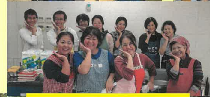
もちつき会ボランティア