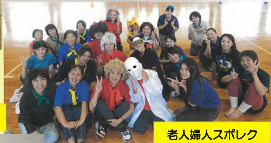
老人婦人スポレク