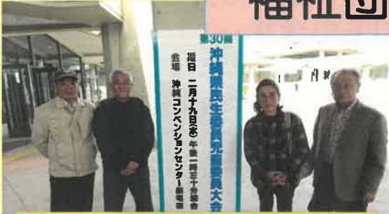
民生委員児童委員協議会