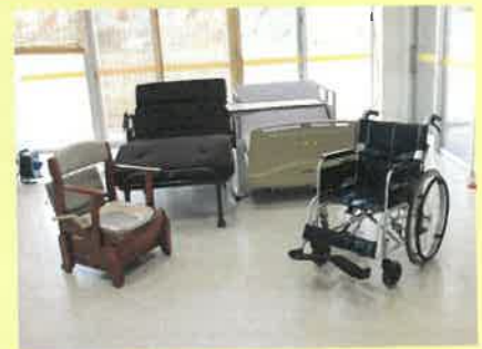
ポータブルトイレ 電動リクライニングベッド 車いす