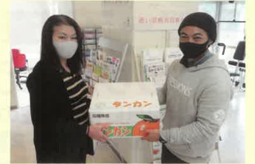
やんばる自然塾様より「タンカン」の寄贈

沖縄県母子寡婦福祉連合会より、コロナ禍の影響を受けた中での緊急支援として「食のパッケージ配布事業」が行われました。村民生委員児童委員により、村内のひとり親世帯や生活困窮者へ延べ14件、計31セットを10月・12月・3月の3回に分けて配布が行われました。また、やんばる自然塾様より寄贈いただいたタンカンは、3月の対象者へ同時に配布されました。