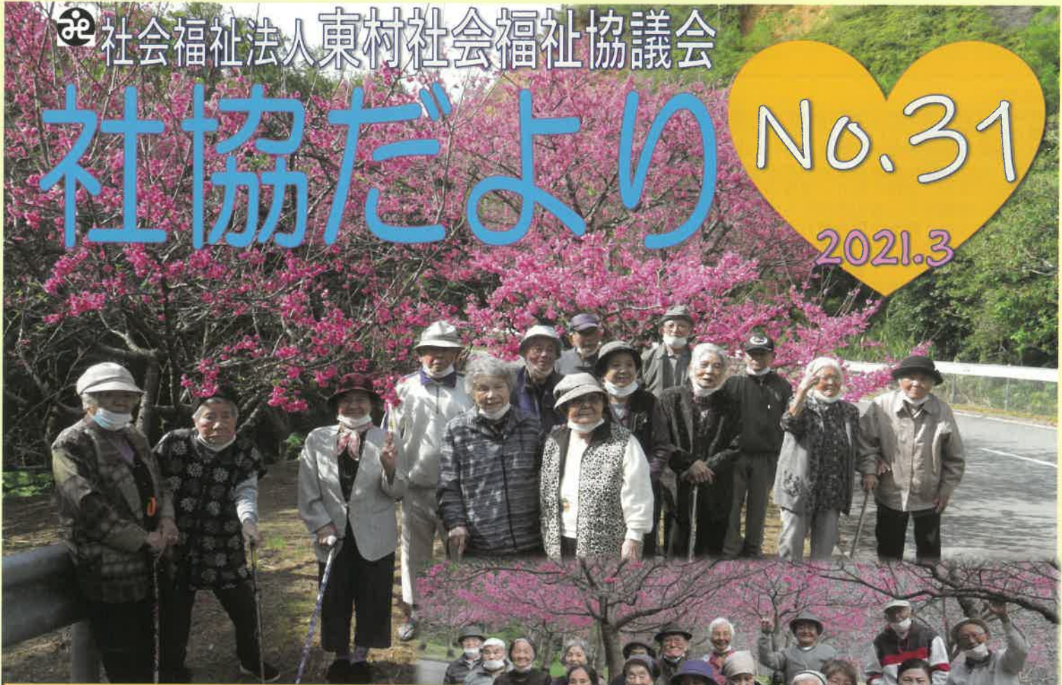
ふれあいサロン花見