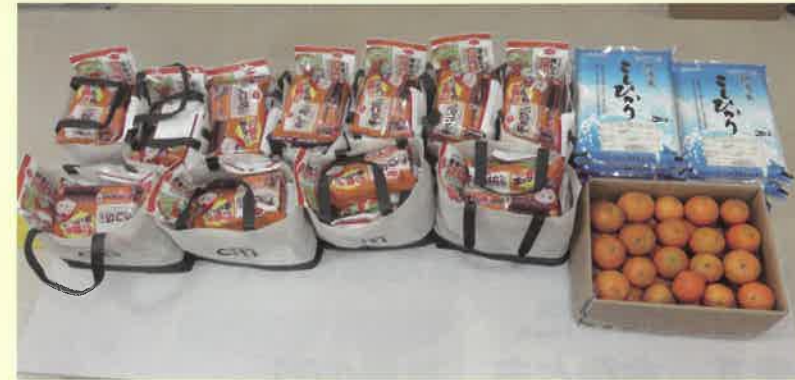
食のパッケージの配布を行いました。

地域福祉増進のために、生活や福祉全般に関する相談・援助を行っており、村と地域住民を結ぶ「かけ橋」として活動しています。主任児童委員は、子どもや子育てに関する支援を専門に担当する民生委員・児童委員です。