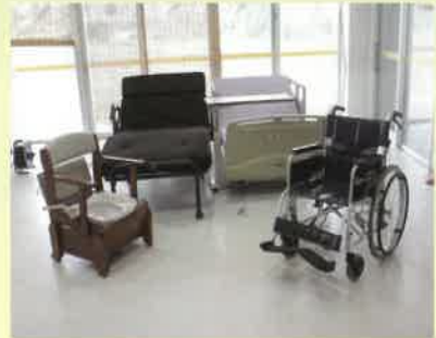
ポータブルトイレ